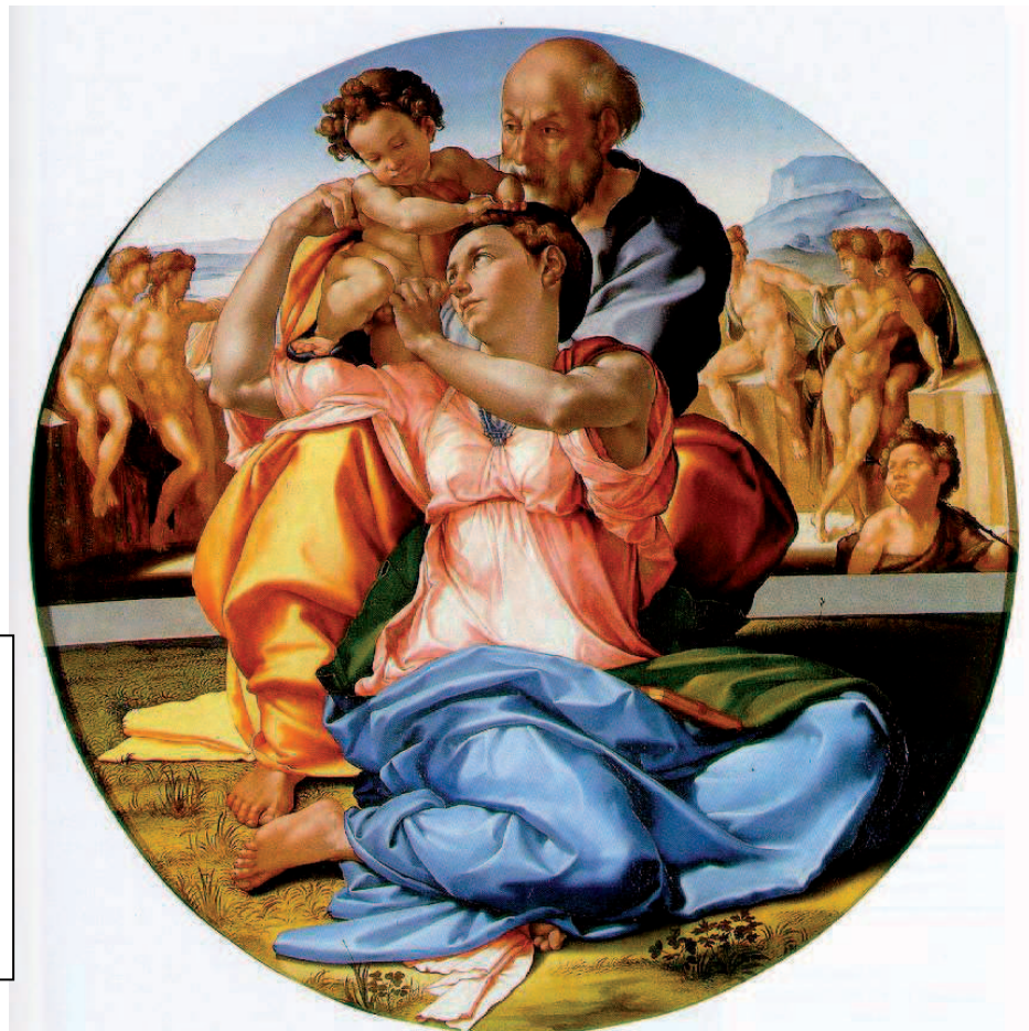
IMATGE 2 / IMAGEN 2

Imagen 1. La creación de Adán. Techo de la Capilla Sixtina, Vaticano. Miguel Ángel, 1510-11.