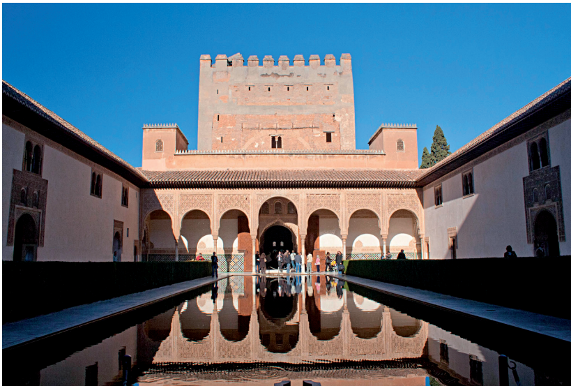
Imagen 3: Patio de los Arrayanes. Terminado en 1370. La Alhambra. Granada.

Imatge 3: Pati de 'los Arrayanes'. Acabat en 1370. L'Alhambra. Granada.