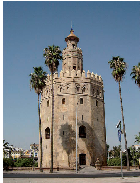
IMATGE 3 / IMAGEN 3

Imagen 2: Torre del Oro. Siglo XII (Con añadidos posteriores). Sevilla.