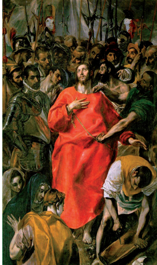
Imagen 1: El expolio. 1577-1579. El Greco.

Imatge 1: L'espoli. 1577-1579. El Greco.