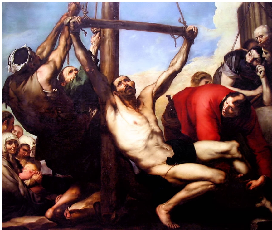
Imagen 2: El martirio de San Felipe. 1639. José Ribera.

Imatge 2. El martiri de Sant Felip. 1639. José Ribera.