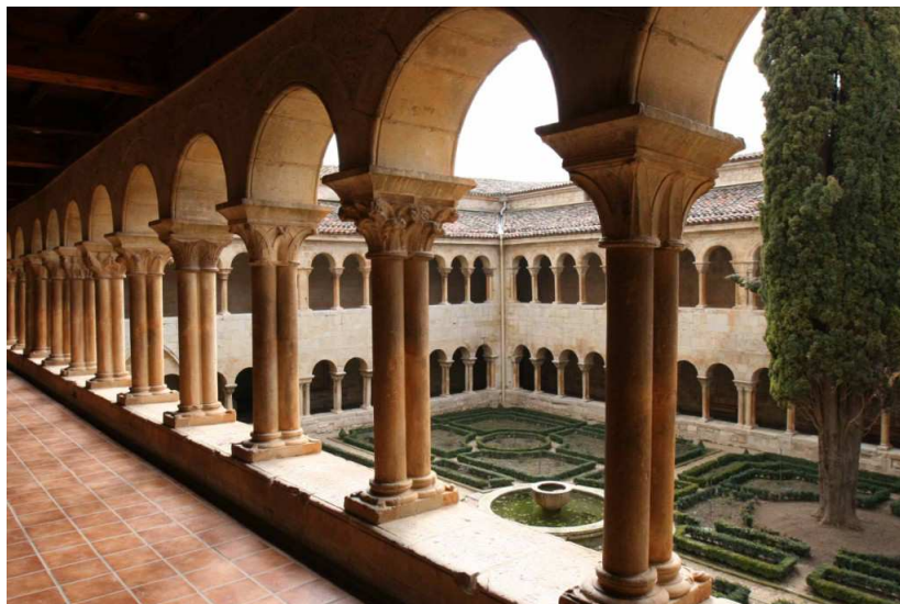
IMATGE 3 / IMAGEN 3

Imagen 2. Claustro de Santo Domingo de Silos (Burgos). Siglos XI-XII