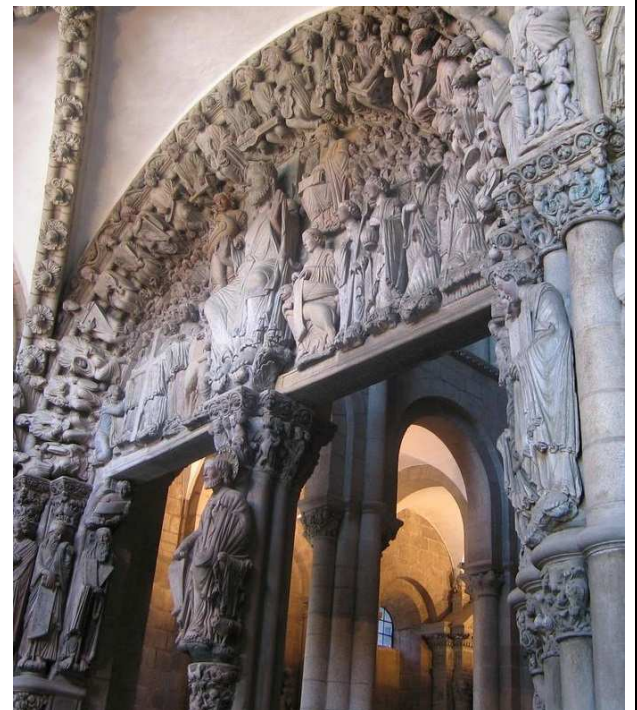
Imagen 3. Pórtico de la Gloria, Catedral de Santiago de Compostela. 1168-1188. Maestro Mateo

Imatge 3. Pòrtic de la Gloria, catedral de Santiago de Compostel·la. 1168-1188. Mestre Mateo