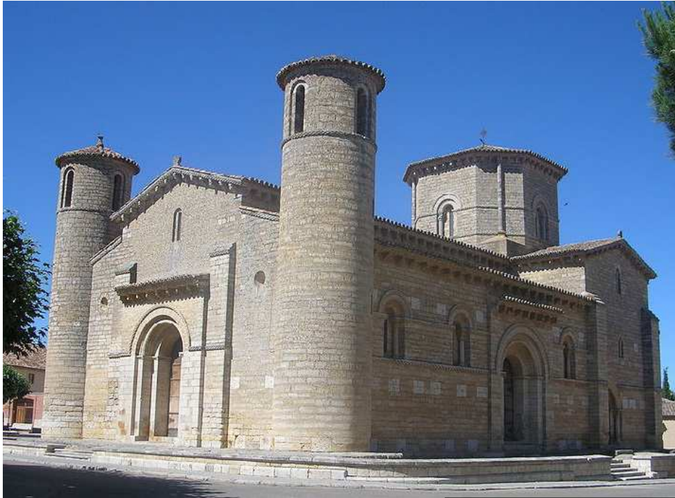
IMATGE 1 / IMAGEN 1

Imatge 1. Sant Martí de Frómista, (Palència). Segles XI-XII