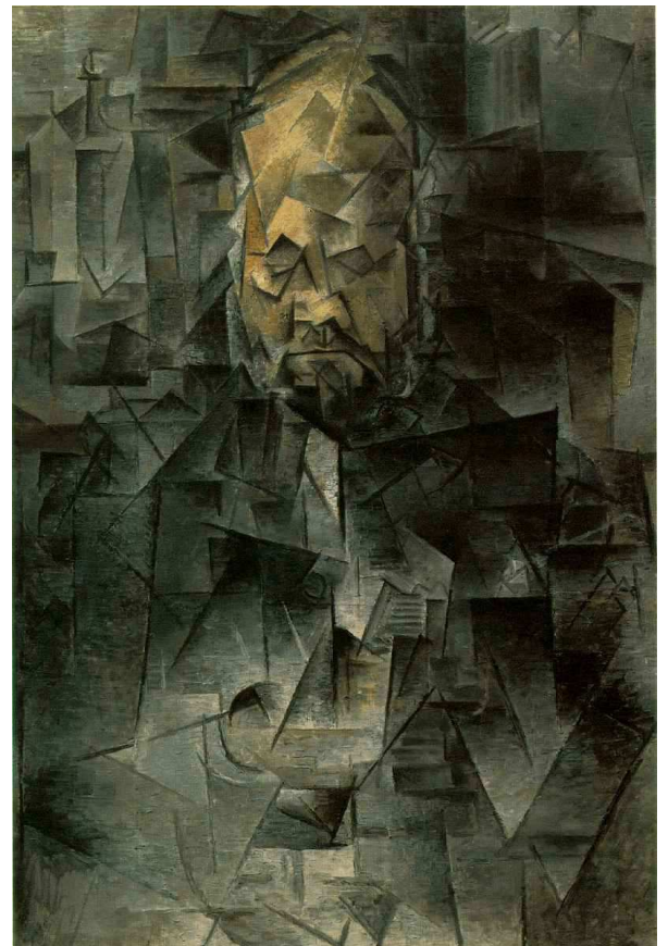
Imagen 2: Retrato de Ambroise Vollard . Picasso. 1909-1910.

Imatge 2: Retrat d'Ambroise Vollard. Picasso. 1909-1910.