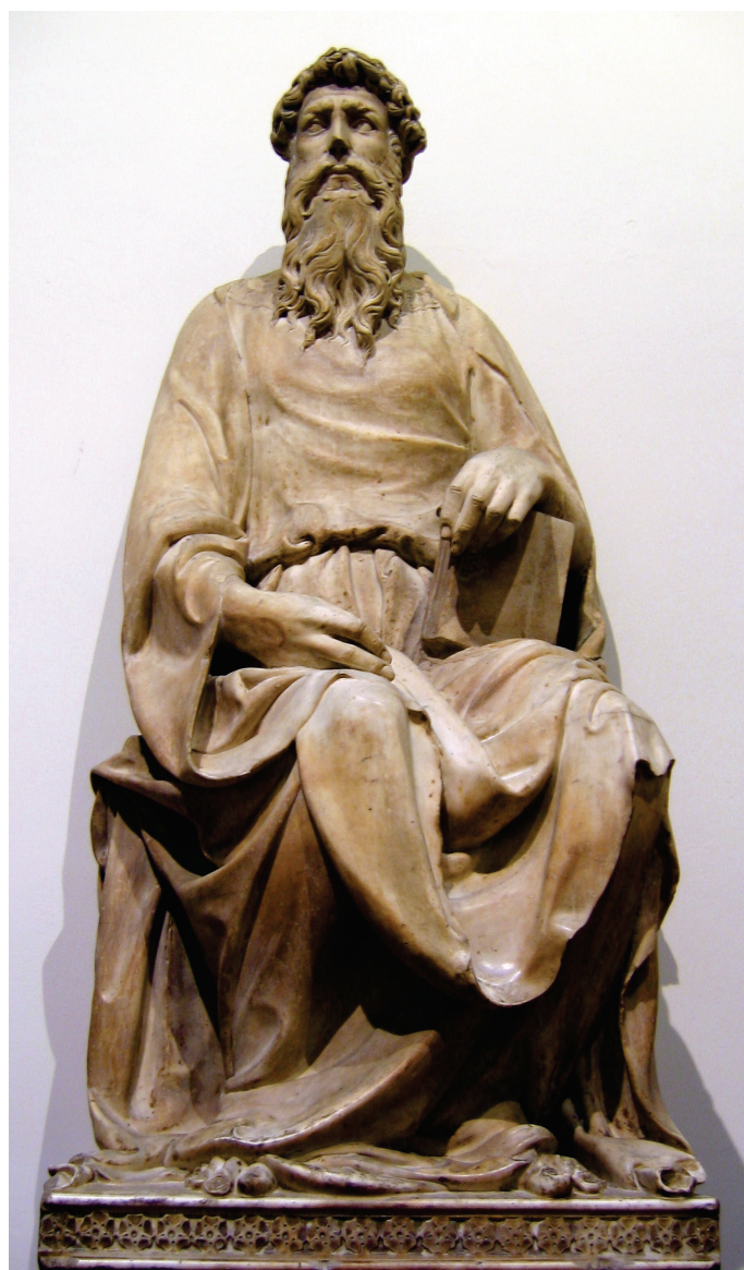
IMATGE 2 / IMAGEN 2

Imagen 1: David . Donatello. Hacia 1440.