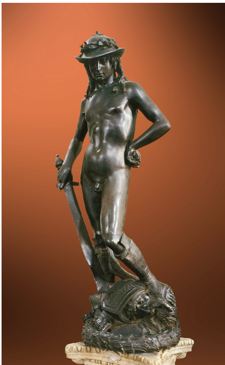
IMATGE 1 / IMAGEN 1

Imatge 1: David . Donatello. Hacia 1440.