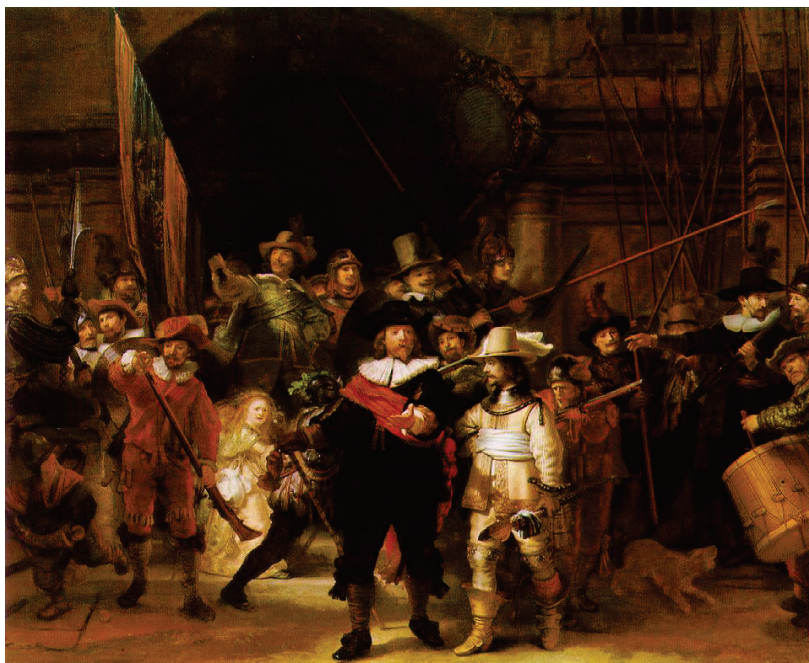
Imagen 1: La Ronda de noche . Rembrandt. 1641-1642.

Imatge 1: La Ronda de nit . Rembrandt. 1641-1642.