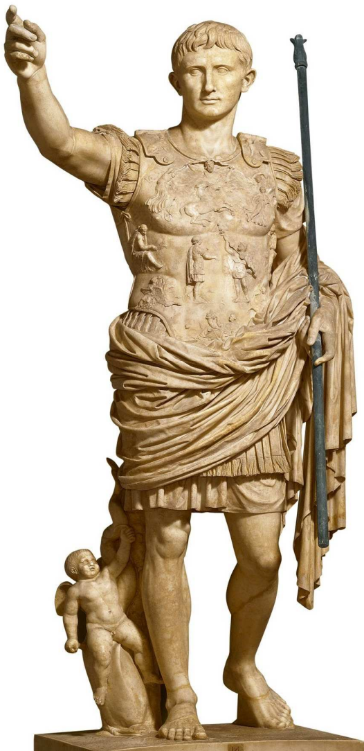
IMATGE 1 / IMAGEN 1

EXERCICI B / EJERCICIO B JULIOL 2017 / JULIO 2017