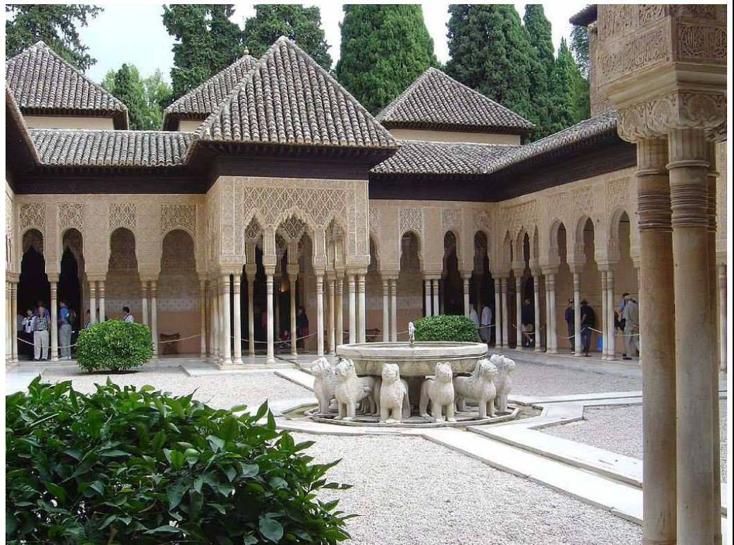
IMATGE 2 / IMAGEN 2