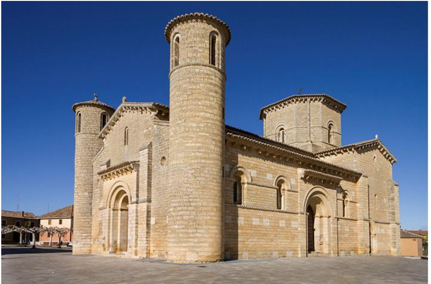
Imatge 1. San Martín de Frómista Imagen 1. San Martín de Frómista.