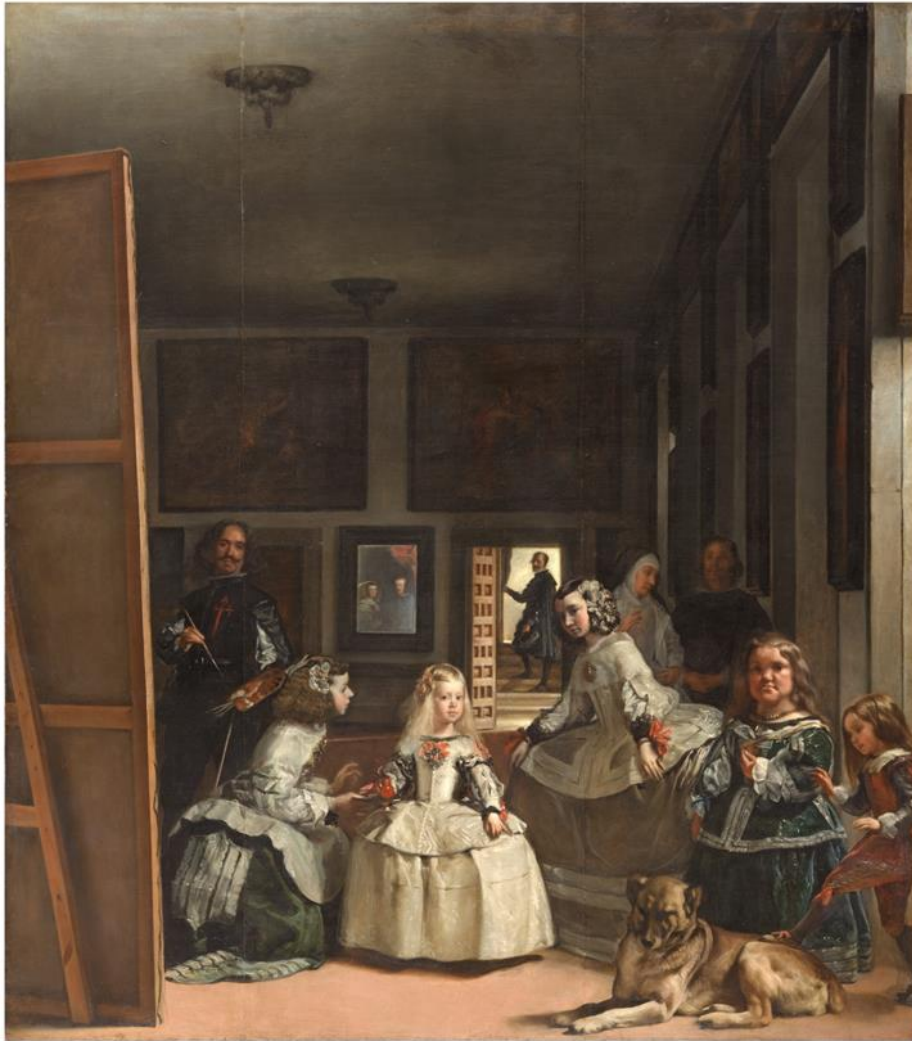
Imatge 4. Velázquez. Las Meninas . Museu Nacional del Prado, Madrid, 1656.