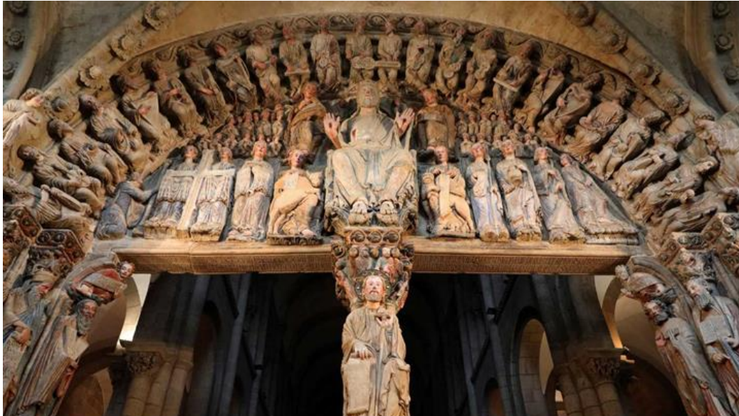
Imatge 2. Pòrtic de la Glòria. Catedral de Santiago de Compostel·la Imagen 2: Pórtico de la Gloria. Catedral de Santiago de Compostela