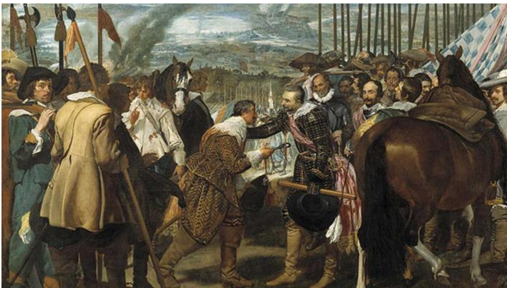
Imatge 5. Velázquez. La rendició de Breda . Museu Nacional del Prado, Madrid, 1630-1635.