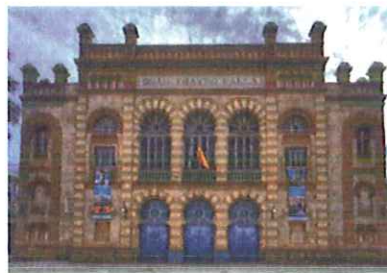
Autor: Título: Estilo: