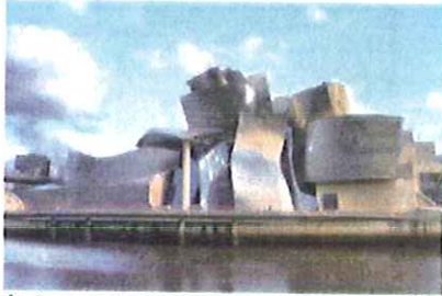
Autor: Título: Estilo:

3.- Relaciona las siguientes imágenes con sus autores, título, corrientes. (Máximo 1,5puntos)