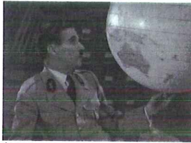
Autor: Título: Estilo: