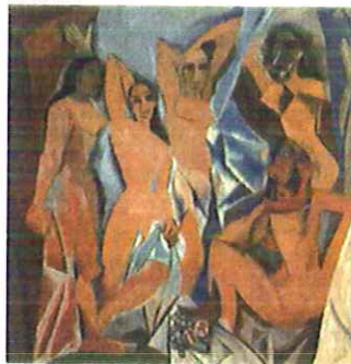
Autor: Título: Estilo: