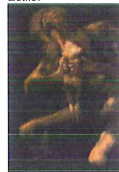
Autor: Título: Estilo:

4.- Completa con una única respuesta los siguientes enunciados (Máximo 1punto)