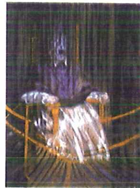
Autor: Título: Estilo:

4.- Completa con una única respuesta los siguientes enunciados (Máximo 1punto)