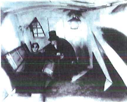
Autor: Título: Estilo:

3.- Relaciona las siguientes imágenes con sus autores, título, corrientes. (Máximo 1,5puntos)