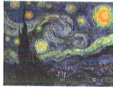
Autor: Título: Estilo: