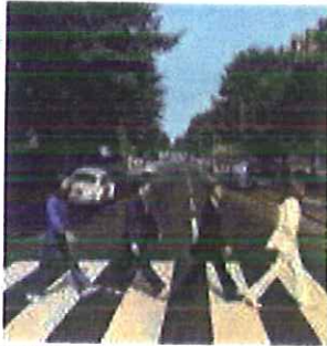
Autor: Título: Estilo: