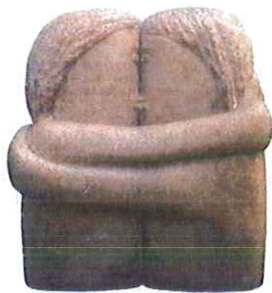
Autor: Título: Estilo: