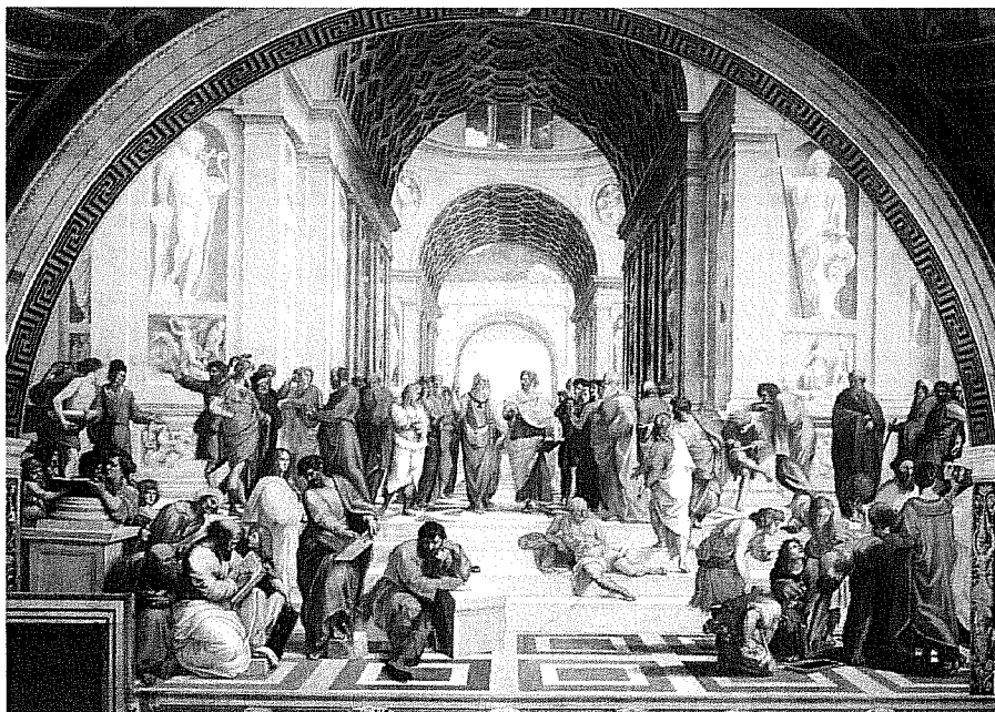
Lámina 1 (B)