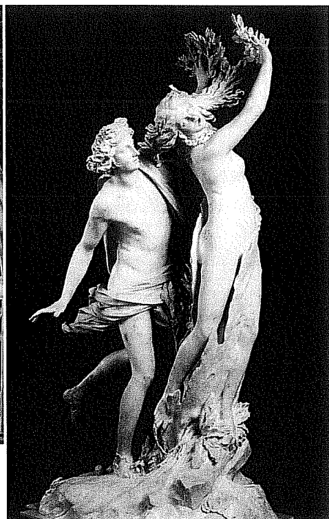
Lámina 2 (B)