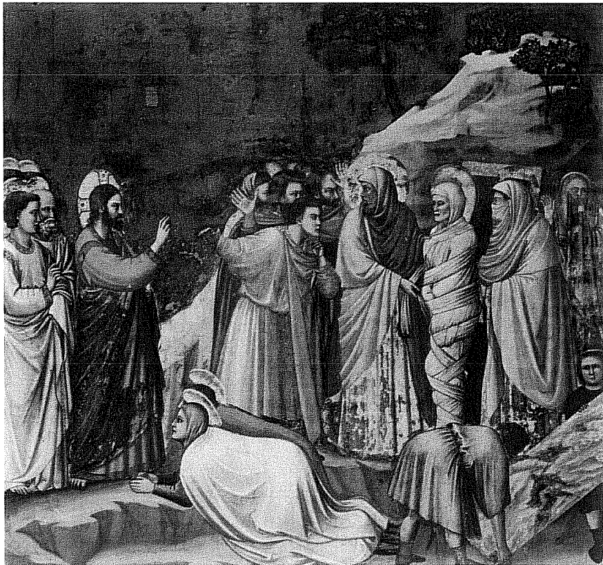
Lámina 2 (A)