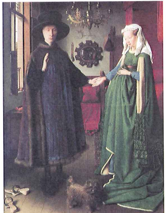
Lámina 2 (A)