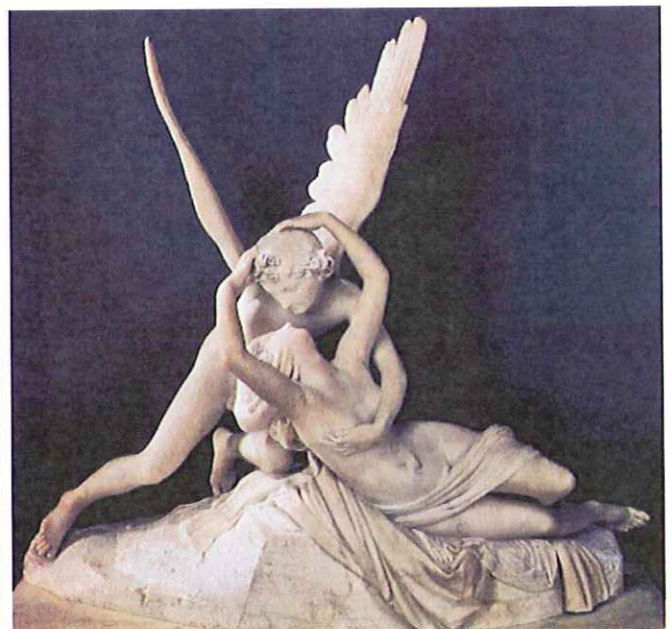
Lámina 2 (B)