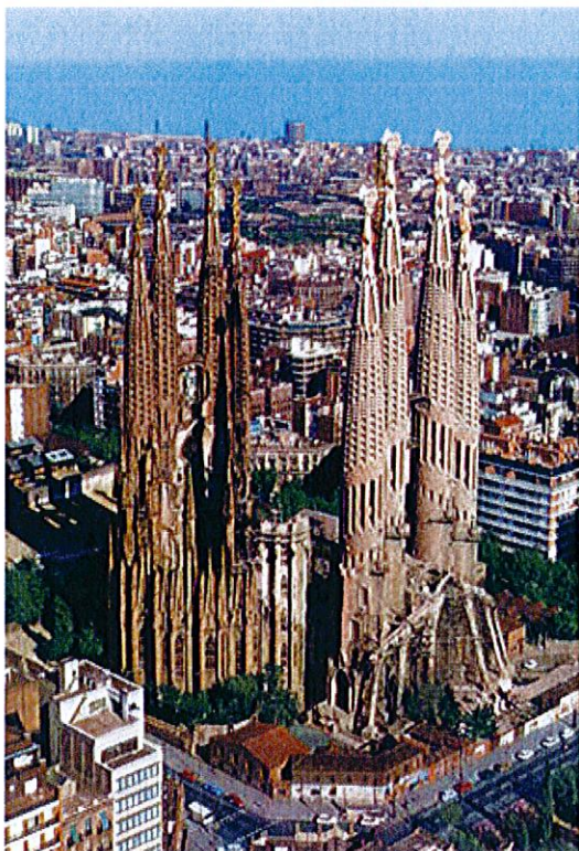
Lámina 1 (B)