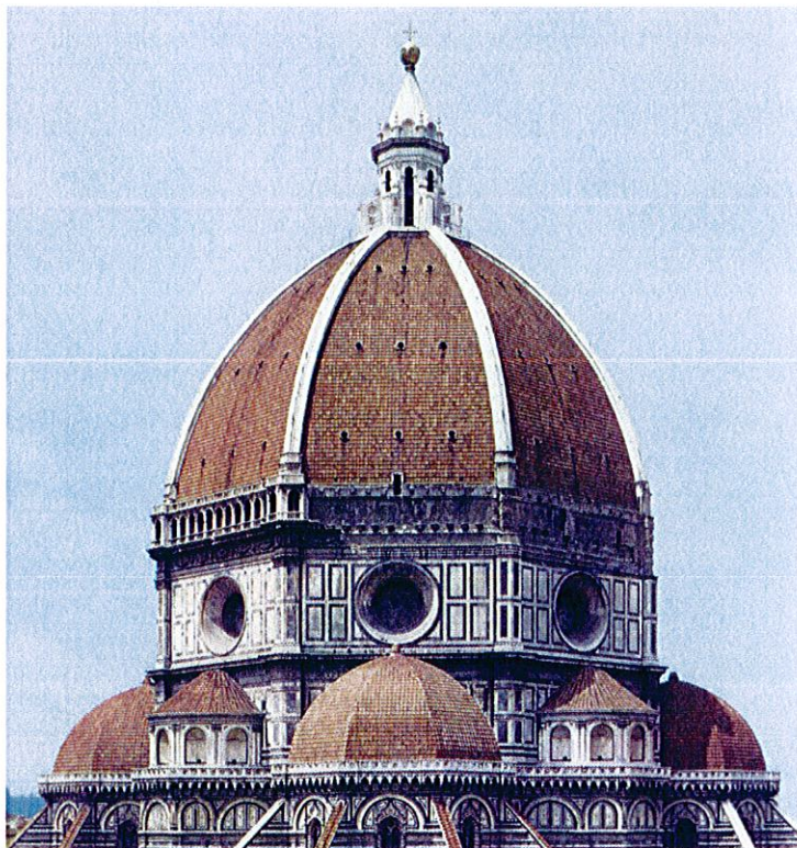
Lámina 2 (A)