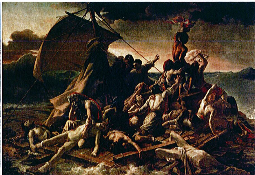
Lámina 2 (B)