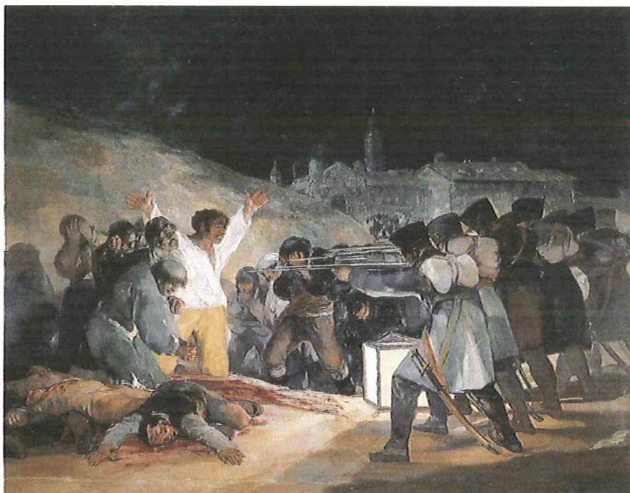
Lámina 2 (B)