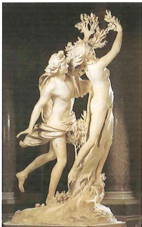
Lámina 1 (B)