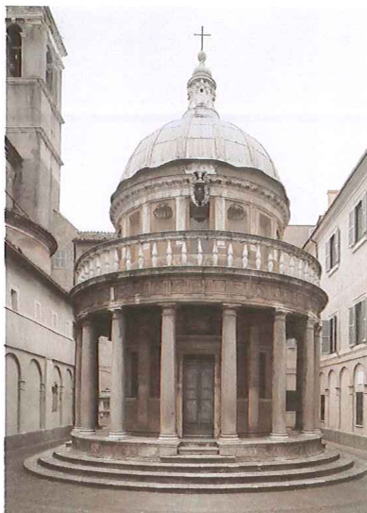
Lámina 2 (A)