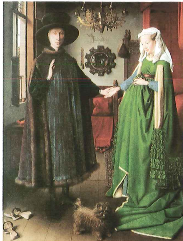
Lámina 2 (A)