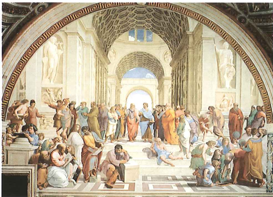
Lámina 1 (B)