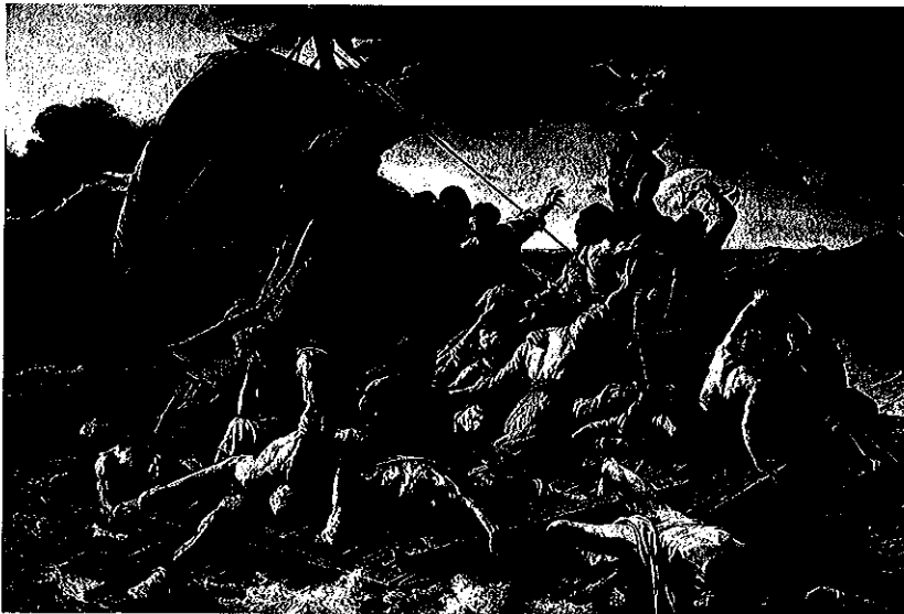
Lámina 1 (B)