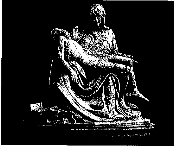
Lámina 1 (A)