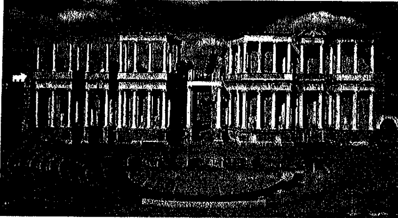
Lámina 1 (A)