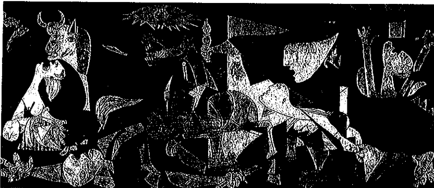
Lámina 2 (B)