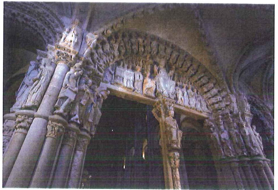
Lámina 2 (A)