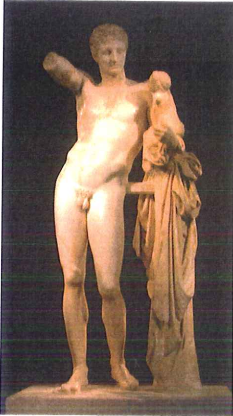
Lámina 1 (A)