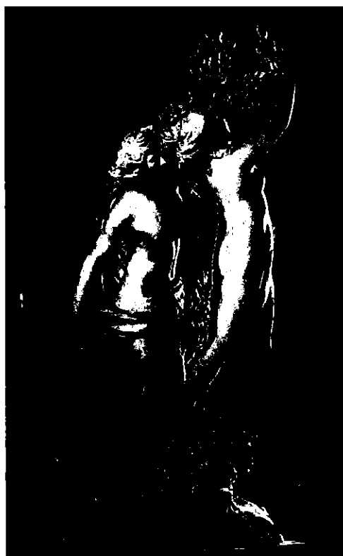
Lámina 1 (B)