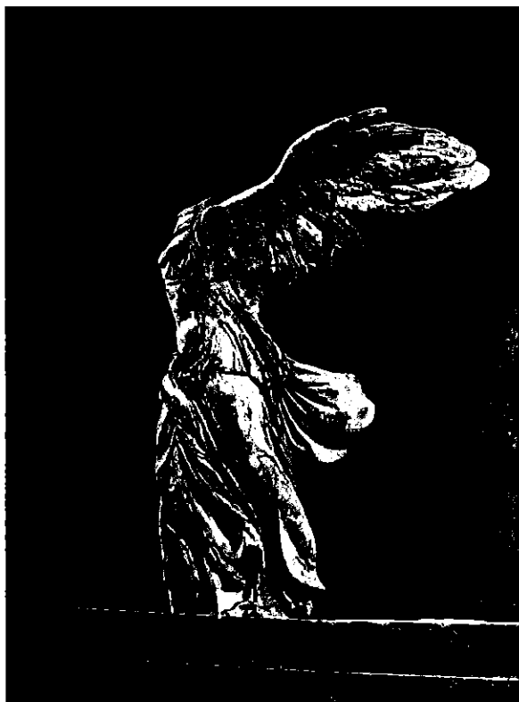
Lámina 1 (A)